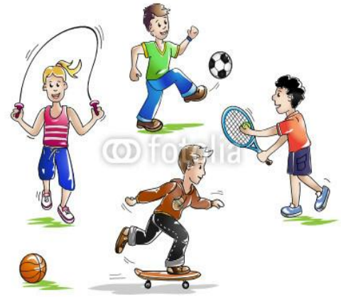
Corso per Istruttori Settore Giovanile – Avanzato-