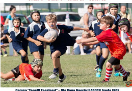
Evento "Zanelli Tassinari" - Via Papa Onorio II 40020 Imola (BO)